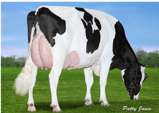
VIEW-HOME MCC FOUND GRANDDAM