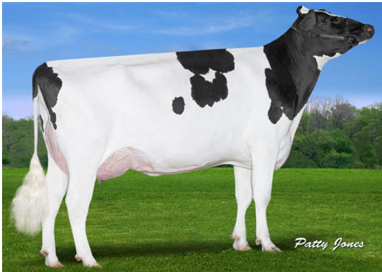
CLAYNOOK FABBY SILVER DAM