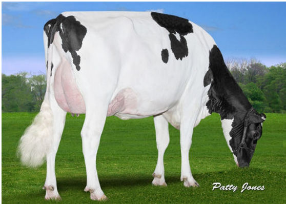
CLAYNOOK FABBY SILVER DAM